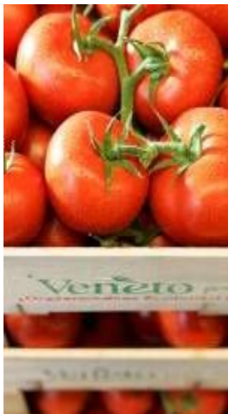
Ovoce a zelenina